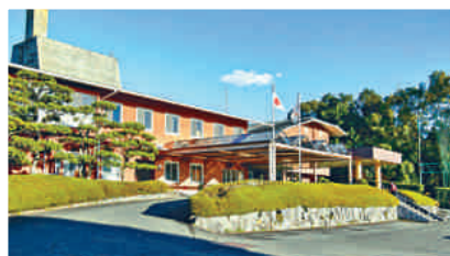
久留米鄉村俱樂部會所。

球會：有明鄉村俱樂部 地址：日本福岡縣大牟田市岬1523 電話：81-944-56-3131 球場：一個18洞球場 開業年份：1974年 球場設計師：富澤誠造 總長/桿數：6,797碼/72桿 果嶺費*：平日9,480日圓/假日12,850日圓 球會網址： www.greenland.co.jp/golf/ariake