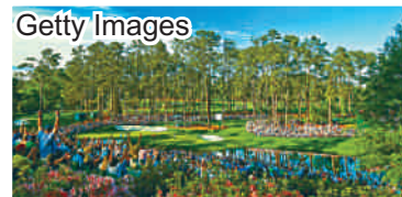
今年美國大師賽冠軍將於香港時間周一凌晨誕生。

被譽為高爾夫四大滿貫之首的美國大師賽，經已在周四開打，今年各球手實力平均，估計今晚的決賽將有一番激烈角逐。