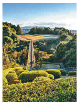
一百七十碼的久留米球場第六洞需要發球過崖。

隨後五百三十碼、五標準桿的第七洞急速上山，球會需要把果嶺上的旗桿加長，方便球友抬頭洞悉進攻方向。對喜愛接受挑戰的球友，久留米是個不容錯過的球場。