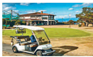
有明鄉村俱樂部會所。

格林度假村的兩個十八洞球場，早前在本欄已介紹過，是個適合共敘天倫的度假球場，平坦的園林式設計，可以懷着輕鬆心情迎戰，待培養好信心之後，便可跨縣挑戰不同風格的久留